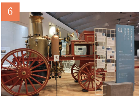
6 生きる力 暮らしの中の工夫