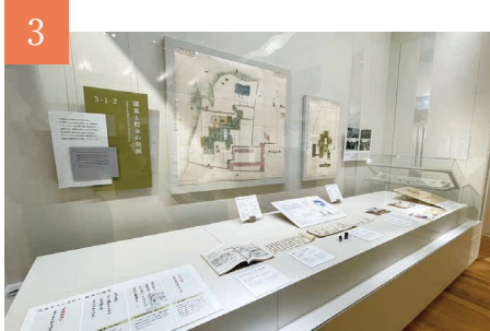
3 開かれた盆地 行き交う自然の恵