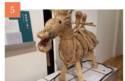
5 伝えてきた心 人々の祈りの形