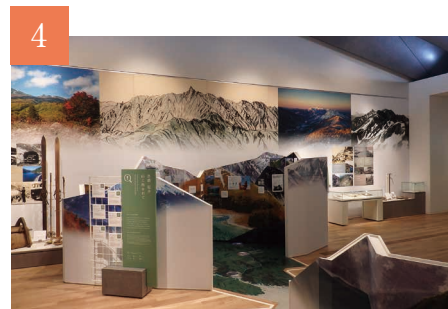
4 ともにある山 山に生き山を活かす