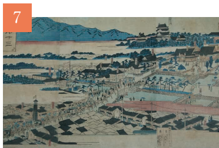
7 変わりゆく社会 市民が担うまちづくり