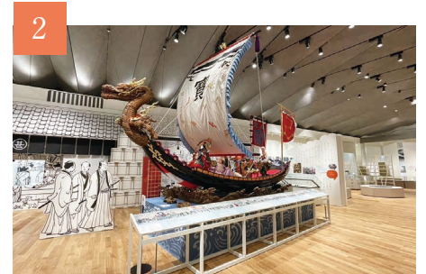
2 にぎわう商都 城下の人々と祭り